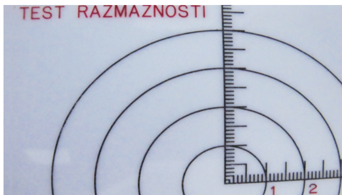
Slika 2: Test razmaznosti na tarčni plošči ob enkratni maksimalni obremenitvi (100 g/ 30 sek.)

Preizkušanje je pokazalo, da so vsi izdelki stabilni in, da odgovarjajo zahtevam. S tem je podana možnost razširitve palete mazilnih podlag, kot tudi kakovostna zamenjava za nekatere že obsoletne podlage emulzijskega tipa V/O ali amfifilne podlage.