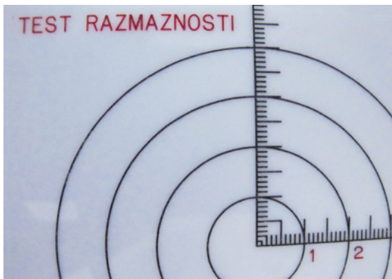
Slika 2: Test razmaznosti na tarčni plošči ob enkratni maksimalni obremenitvi (100 g/ 30 sek.)